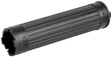
MSM 22 Montageschlüssel

Siehe unten: Zulassungen und Konformitäten