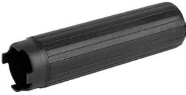
MSM 16 Montageschlüssel

Siehe unten: Zulassungen und Konformitäten