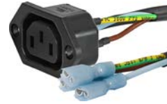
6600 Dose mit Kabelkonfektionierung

Siehe unten: Zulassungen und Konformitäten