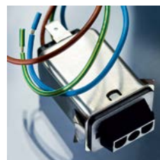
5003 - Stecker-Filter, Schnapp-Montage mit Kabelanschluss