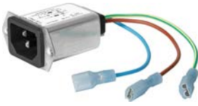
5120 Filterstecker mit Kabelkonfektionierung