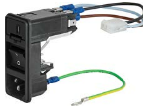
KD Kombielement mit Kabelkonfektionierung