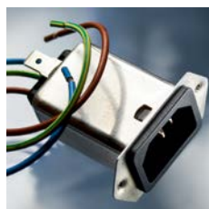
5120 - Stecker-Filter, front- oder rückseitige Montage mit Litzen