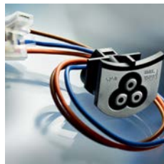
5750 Gerätesteckdose mit Kabelbaum