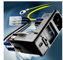
KD Kombielement mit Kabelkonfektionierung