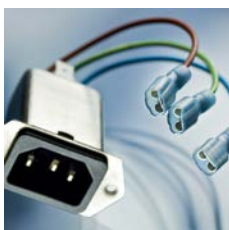
5120 - Stecker-Filter, front- oder rückseitige Montage mit vollisolierten Steckkontakten