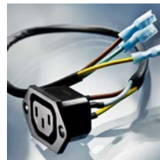
6600 - Gerätesteckdose mit vollisolierten Steckkontakten